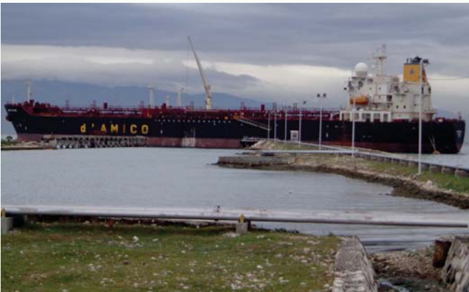
Arrivage de carburant au terminal de Thor

La commande des produits pétroliers demeure une question d'intérêt général par rapport à l'enjeu que cela représente pour le pays. Le BMPAD, dans le cadre de ses attributions, est l'unique entité habilitée légalement à passer les commandes, recevoir, entreposer et commercialiser le carburant ainsi que ses produits dérivés en Haïti. Ce faisant, cette institution agit comme un trait d'union entre les différents acteurs intervenant dans l'approvisionnement de ce produit très stratégique pour le marché local.