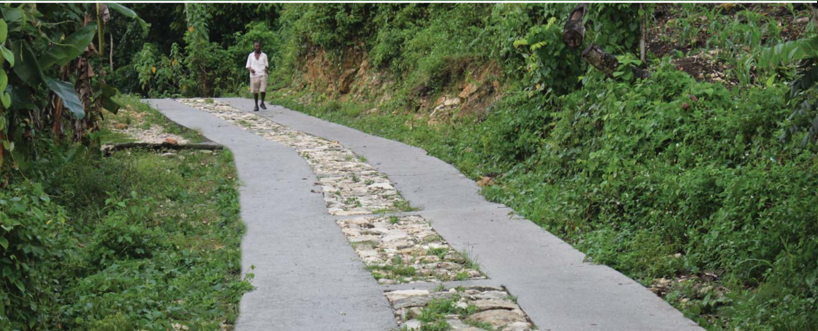
Route d'accès du projet de conservation de sol (Moron, Grand'Anse)

Le Bulletin d'Informations du BUREAU DE MONETISATION DES PROGRAMMES D'AIDE AU DEVELOPPEMENT