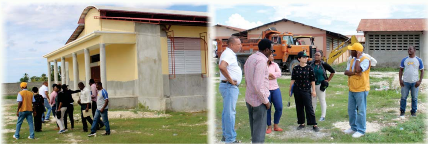
Visite de suivi avec l'ambassade du Japon au lycée de Bocozelle à Saint-Marc