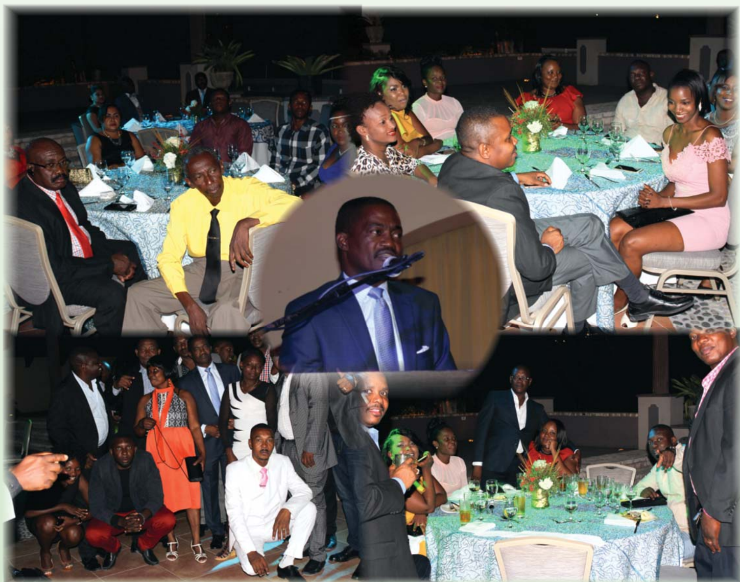
Fête de fin d'année (Décembre 2017)