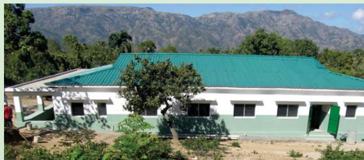
Centre de santé Bois-Pin, Bahon