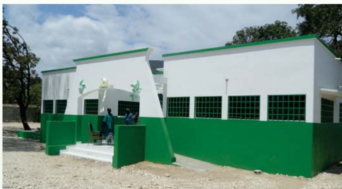
Centre de santé Saint-Raphaël

D ans sa quête d'amélioration des conditions d'existence de la population, l'Etat haïtien a procédé via le BMPAD, entre 2010 et 2015, soit à la construction ou à la réhabilitation d'une trentaine d'établissements de santé, dans le cadre des fonds communaux du programme d'investissement public (PIP).