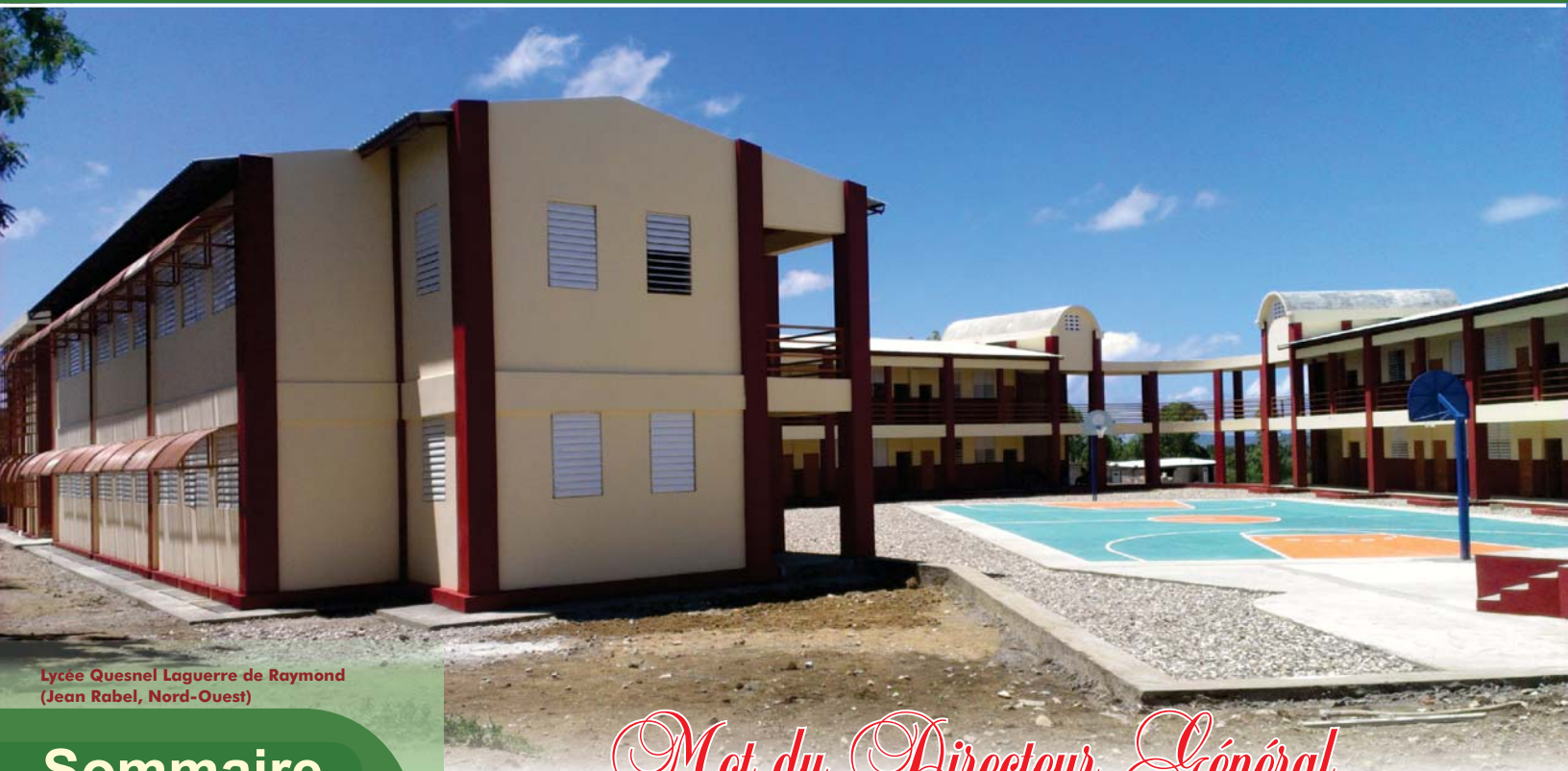
Lycée Quesnel Laguerre de Raymond (Jean Rabel, Nord-Ouest)

Le Bulletin d'Informations du BUREAU DE MONÉTISATION DES PROGRAMMES D'AIDE AU DEVELOPPEMENT