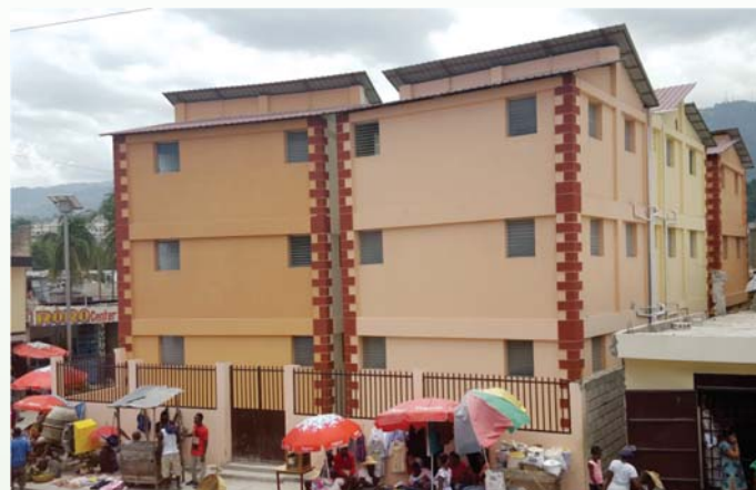
Complexe de la rue Durand, Delmas 32

Les bénéficiaires n'ont pas caché leur satisfaction, car, selon eux, les retombées de ces projets sont positives. Avec l'implémentation de ces derniers, le quartier de Delmas 32 a désormais des communautés visiblement transformées. D'ailleurs, l'introduction de la notion de "complexe multi-famille", comme une nouvelle solution de logement par la mise en commun des parcelles de terre, a permis aux résidents de vivre dans des conditions plus décentes, ont-ils témoigné. C'est une expérience qui interpelle sur la nécessité de