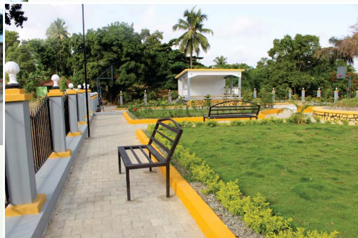
Place publique Capotille (Nord-Est) ▼

A travers les projets qu'il exécute, le BMPAD participe à l'amélioration des infrastructures de base et du développement durable du pays. À cet effet, cet organisme autonome œuvre dans la construction, l'aménagement, la réhabilitation de places publiques, eu égard aux attributions que lui confère son statut, pour répondre aux obligations des municipalités tout en œuvrant grandement à l'épanouissement de la jeunesse.