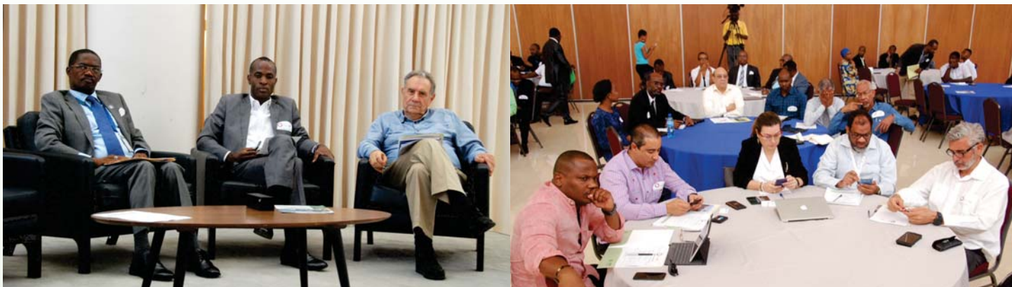
Le DG du BMPAD et les panélistes