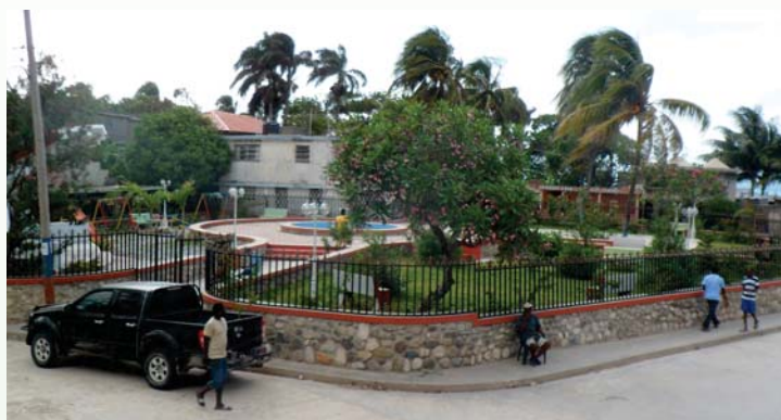
◀ Place publique Sainte-Anne (Anse-à-Foleur, Nord-Ouest)